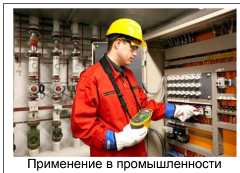
Применение в промышленности