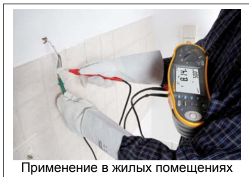
Применение в жилых помещениях